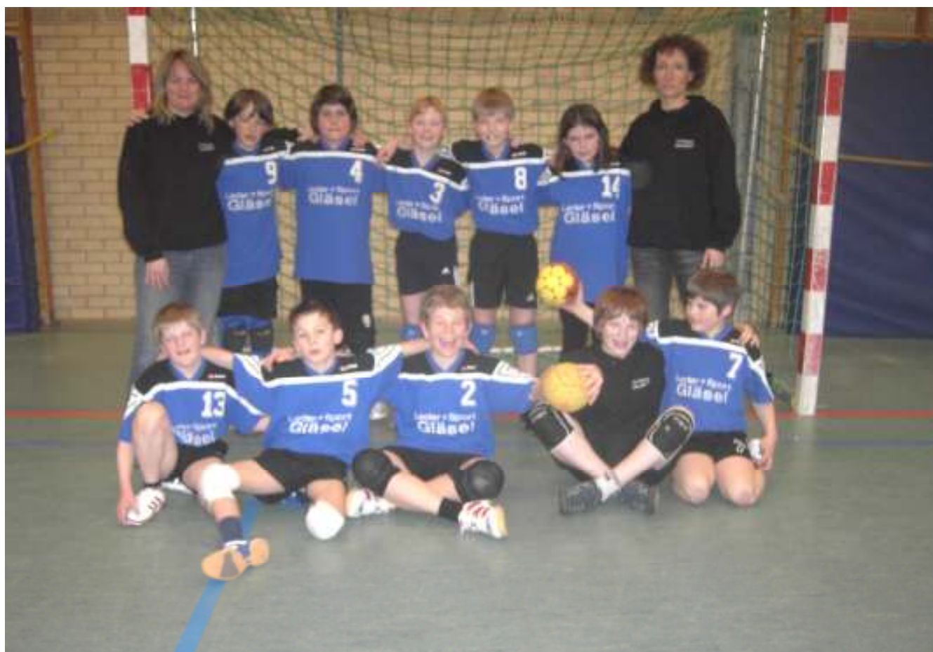
Das Bild zeigt die E-Jugend Mannschaft gemischt/Fortgeschritten Saison 2007/2008 und ihre Trainerinnen

Die Rehauer Handballer konnten drei Siege verbuchen. In teilweise harten aber immer fairen Partien konnten sich die Rehauer gegen Selb, Schwarzenbach und Niederlamitz durchsetzen. In der E-Jugend zählt aber trotzdem nur der sportliche Erfolg. Die Mannschaft geht nun in die Sommerpause, die aber nicht als solche genutzt wird, sondern als Vorbereitungsphase für die neue Saison. Kinder, die sich für Handball interessieren, sind immer gerne willkommen.